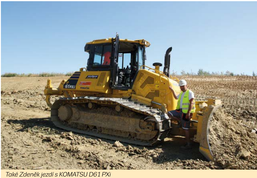
Také Zdeněk jezdí s KOMATSU D61 PXi

povedená mašina.“ Dále chválí výborný výhled, odpružené sedadlo, super spotřebu.