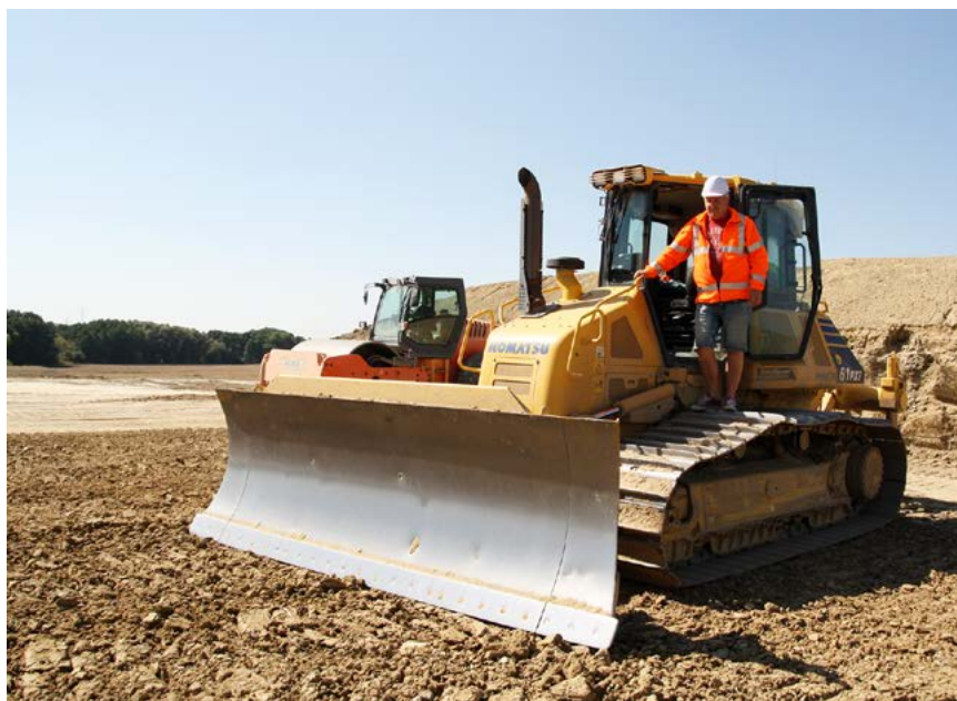
Roman jezdí 23 let a vyzkoušel snad všechny značky. Nyní jezdí na dozeru KOMATSU D61 PXi