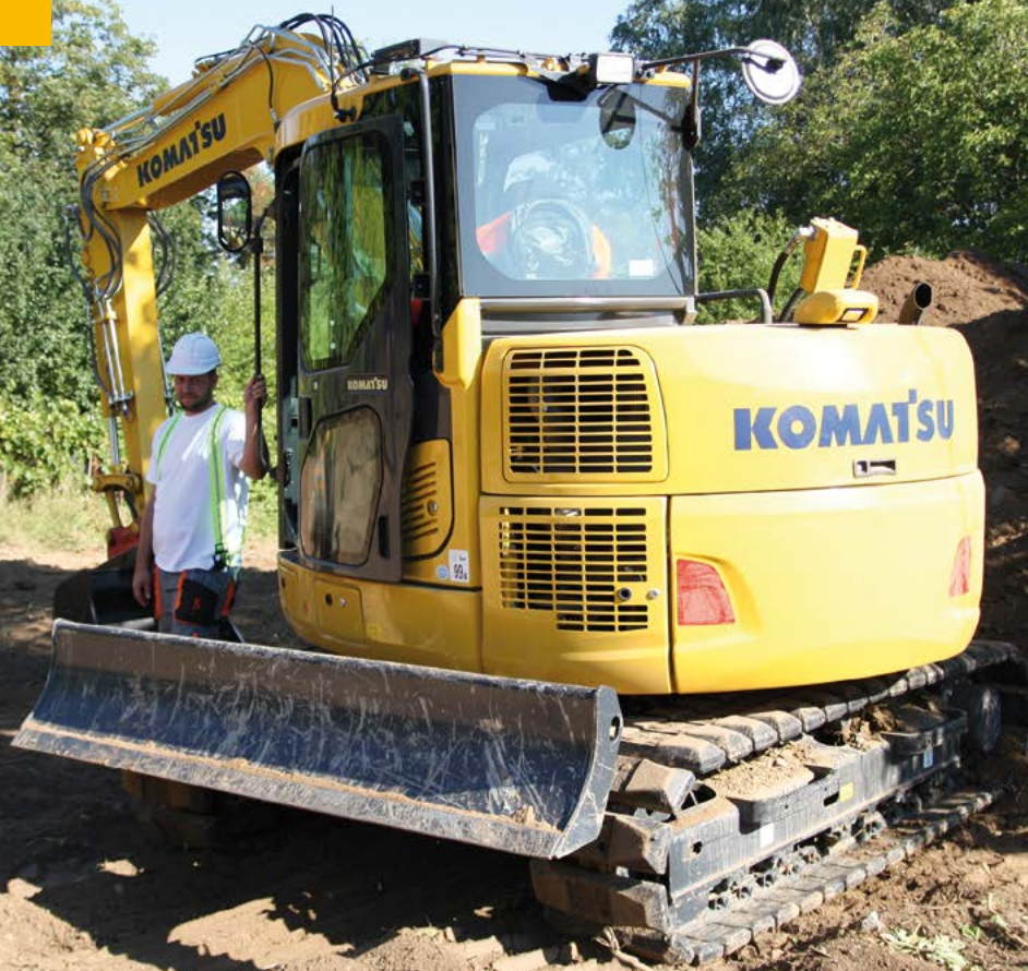
Martin se strojem KOMATSU PC 88MR